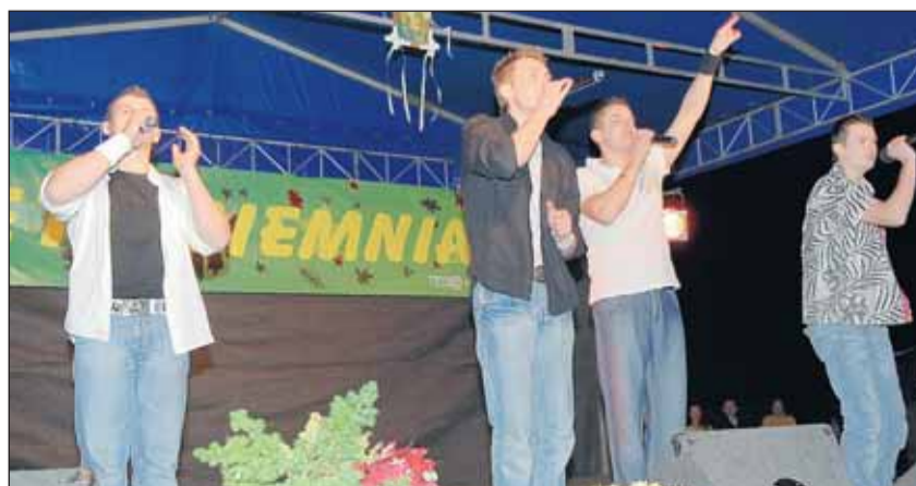
Koncert zespołu Cliver