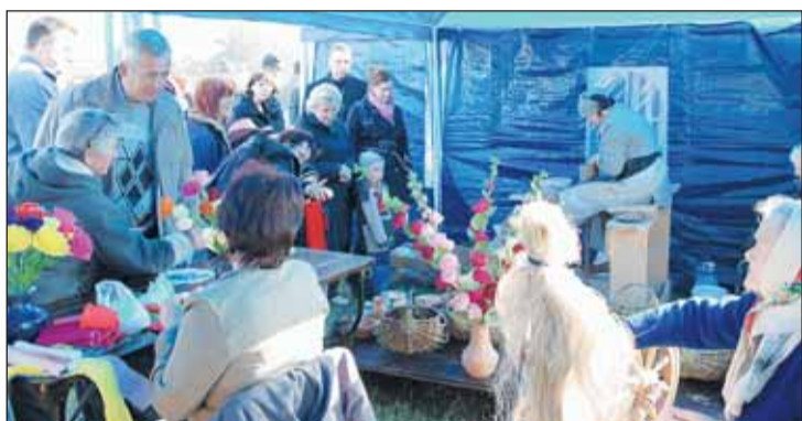
Stoisko twórców ludowych