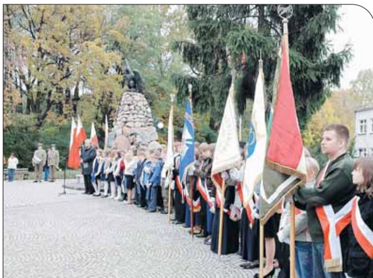
Uroczystości przy pomniku Legionistów w Białostrzegach