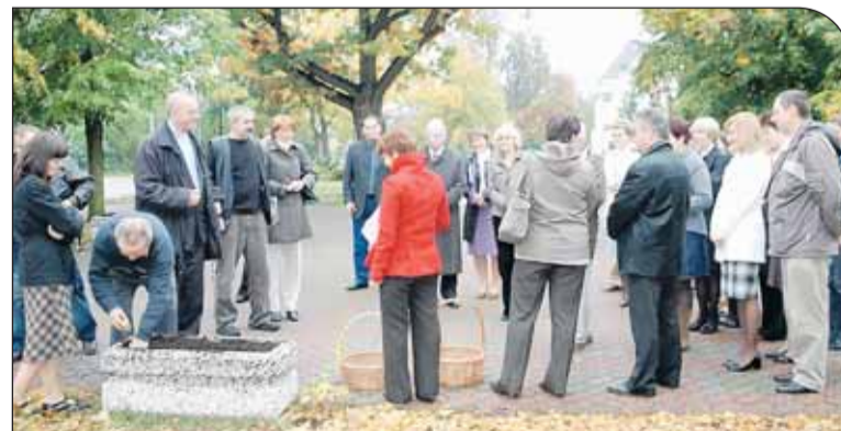
Sadzenie żonkili na Placu Wolności

„Pola Nadziei” to organizowana od 11 lat międzynarodowa i ogólnopolska kampania na rzecz opieki nad osobami terminalnie chorymi. W 2007 roku uczestniczyły w niej 44 hospicja z całej Polski. Wśród nich jest również Hospicjum Domowe Zgromadzenia Księża Marianów w Warszawie, którego pracownicy i wolontariusze „ośmielają się mówić, że nadzieja zawsze jest blisko tych, którzy przeżywają trudne doświadczenia”. Dzięki udziałowi w kampanii ludzie dobrej woli i firm, gromadzone są środki potrzebne do bieżącego funkcjonowania Ośrodka,