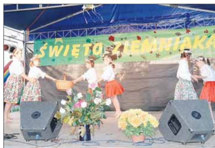
Zespół ludowy w układzie „Koszyczek”