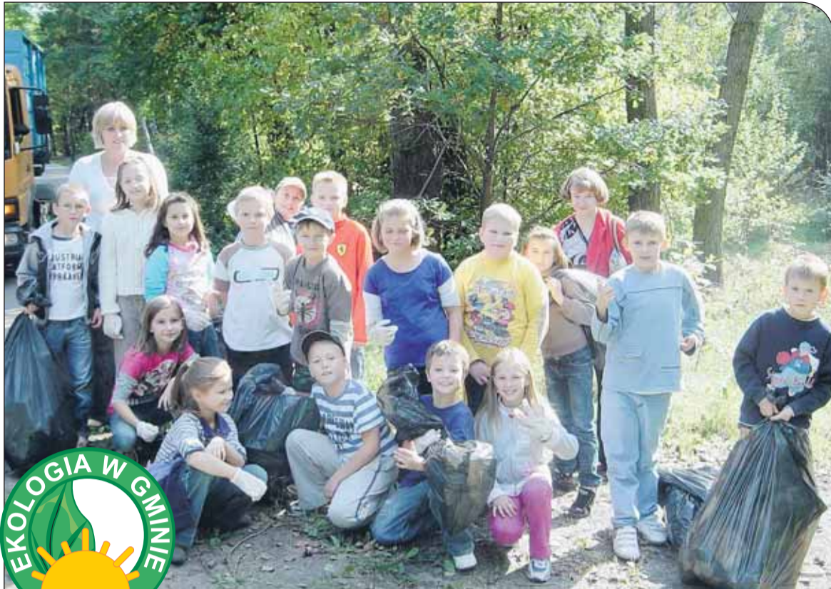
Uczniowie szkoły w Józefowie w akcji