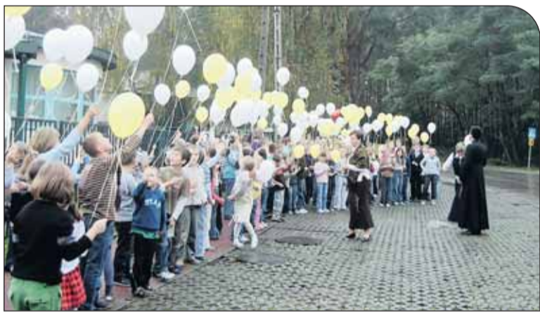
Baloniki szybowaty nad szkołą w Józefowie