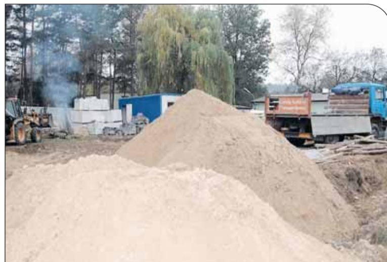
Budowa przedszkola w Zegrzu Południowym

Przetarg na budowę przedszkola rozstrzygnięto w czerwcu, niestety jedna z firm biorących w nim udział, niezadowolona z wyniku, wniosła protest, a następnie odwołanie do Urzędu Zamówień Publicznych. W sierpniu zostało ono przez Krajową Izę Odwoławczą oddalone, a wszystkie zarzuty firmy uznano za bezzasadne. Pomimo opóźnienia spowodowanego odwołaniem, środki zaplanowane w budżecie na budowę przedszkola w 2008 roku zosta-