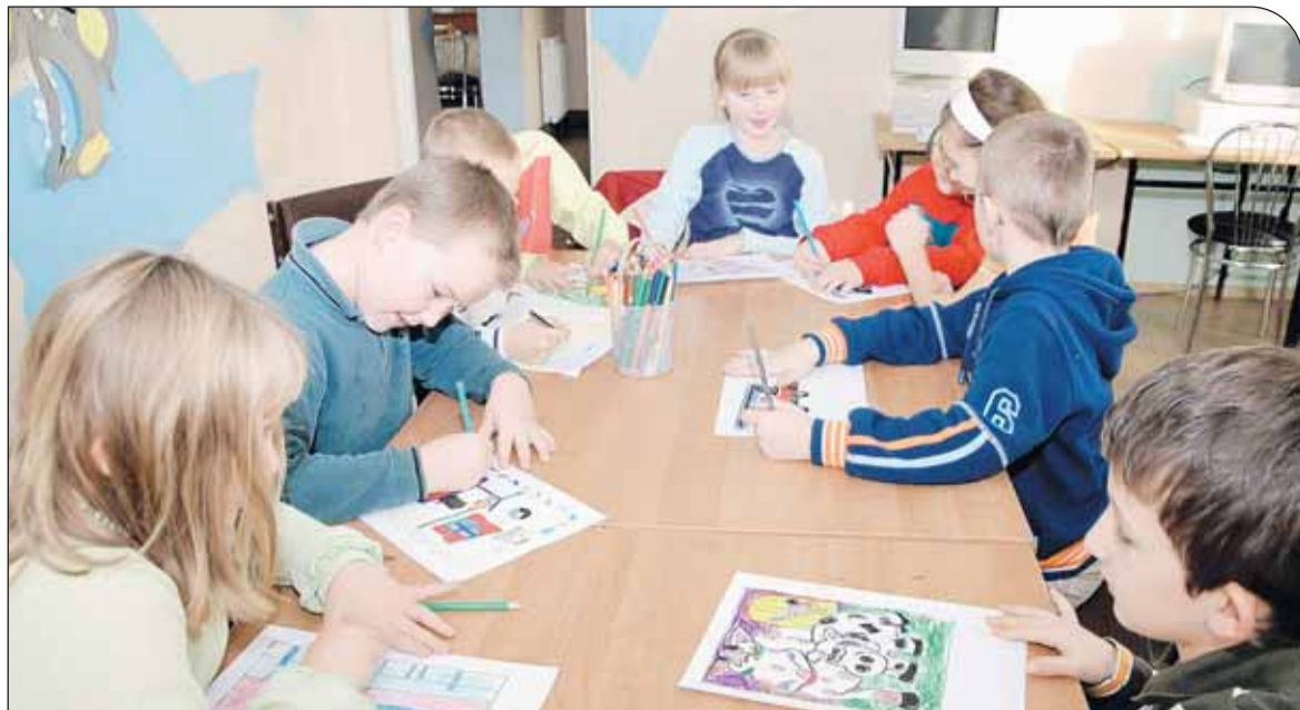
Zajęcia plastyczne w ognisku w Ryni