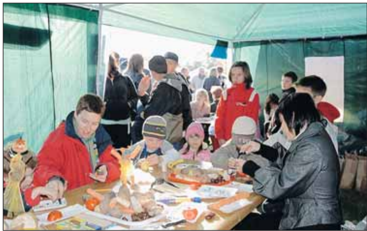
Warzywne fantazje w stoisku GOK