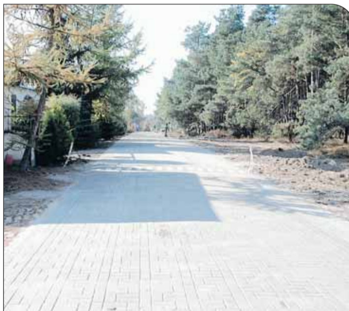
Nowy ciąg pieszo-jezdny przy ulicy Małoleckiej

Dobiegają końca prace na ulicy wewnętrznej od ulicy Małoleckiej w Nieporęciu. Ciąg pieszo-jezdny długości 300 metrów, z wjazdami do posesji, wykonuje firma Partner z Chotomowa. Droga ma 6 metrów szerokości, nawierzchnia z kostki położona została na podbudowie z kruszywa łamanego. Przebudowa uwzględni również odwodnienie – na poboczach wykonywany jest drenaż w postaci sączków filtrujących z tłuczni. Koszt prac wyniesie ok. 230 tys. zł.