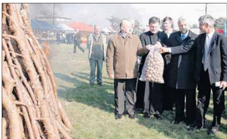
Rozpalenie festynowego ogniska