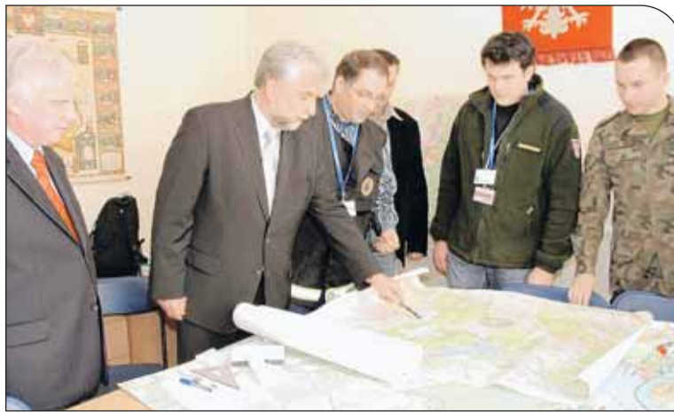
Narada w Urzędzie Gminy