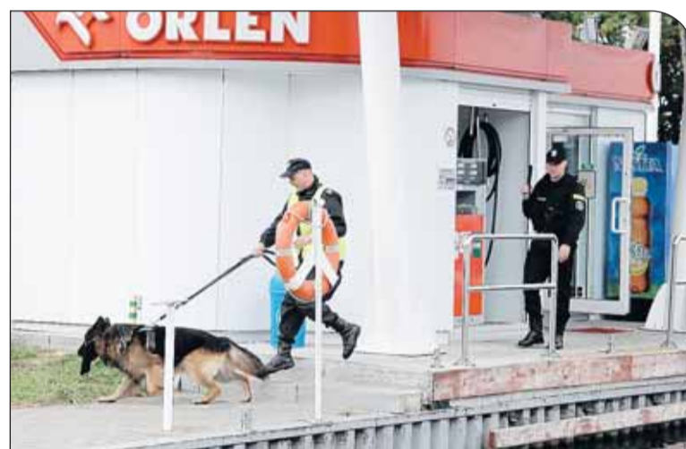
Pies tropiący w akcji na terenie Portu Jachtowego

W czwartek realizowano przeprowadzenie akcji kurierskiej, wprowadzenie stanu gotowości obronnej na terenie gminy, przygotowanie do udzielenia pomocy – zakwaterowania i wyżywienia dużej ilości poszkodowanych. Odebrano również sygnał o sabotażu w piekarni Lantmannen Unibake w Stanisławowie Pierwszym, gdzie doszło do wycieku 300 l amoniaku. W akcji włączyły się odpowiednie służby ratownicze i niebezpieczeństwo zostało zażegnane.