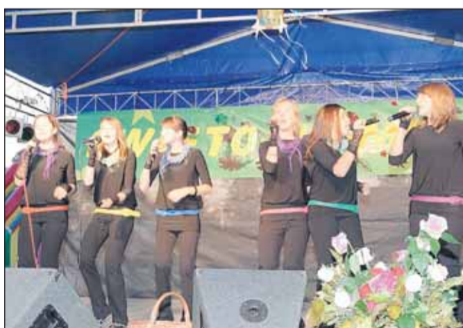
Występuje Studio Piosenki