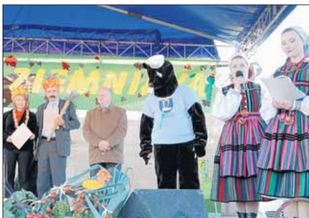
Prezentacja Bobra – gminnej maskotki