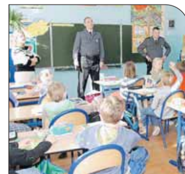
Wizyta w klasie pierwszej

Z inicjatywą rozpowszechniania materiałów odbłaskowych wśród uczniów gminnych szkół wyszli policjanci, którzy zgłosili się ze swoim pomysłem do Urzędu Gminy Nieporęt. Efektem współpracy są właśnie