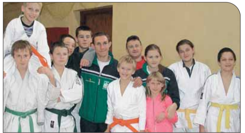
Judocy UKS Piława

Po wakacyjnej przerwie pierwszym sprawdzianem dla judoków UKS Piława był Międzynarodowy Turniej Judo Dzieci i Młodzików w Wiśniowej Górze pod Łodzią.