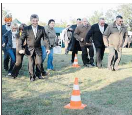
Wyścigi radnych i sołtysów